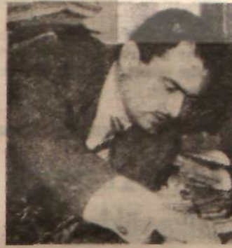
Maden — İş Başkanı Türkler — Sorumluluğa katılmadı —

Sözcülerin tenkidlerinden sonra kürsüye gelen Çalışma Bakanı Bülent Ecevit, ta-