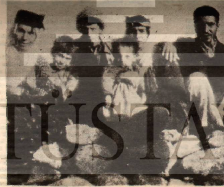
Az gelişmiş Türkiye'nin geri kalmış Doğu bölgesinde, Nusaybinin Eski Mağara köyünden bir aile, ırkçı sömürücülerin düşüncelerinden habersiz...

Erdeki hesap çarşıya uymadı. Gençlik, subay ve aydınlar oynamak istenen komedyanın perde arkasını biliyorlardı. İşçi ve köylü yarı taşlarımıza karşı nasıl iki yüzü davranışlarını ise son Kavel olayı bütün keskinliğiyle gösterdi. O güne dek işçiden gibi görünen tüm ırkçı sömürücüler, iş başa düşünce, partilerinin yanında yerlerini aldılar. Gerici basında günlerce «Kavel olayı tehlikeli bir tertiptir» başlığı altında, işçileri en kötü şekilde suçlayan tefrikalar dizildi. Toprak reformu söz konusu edilince aynı menfaat refleksiyle ırkçılar, topraksız köylülere karşı toprak derebeylerini tuttular. Doğu Anadolu'da teşkilâtlanabilmek için bu bölgenin derinlerinden, geri kalmışlığından bahisle Doğuluların sempatisini çekmek istedikler. Oysa aynı sömürücü yaygın organlarında Doğuluları toptan imha için Kırgızları davetten başlıyarak, senatoda ise doğulu yurttaşlarımızı iç düşman olarak ilan etmeye kadar vardılar.