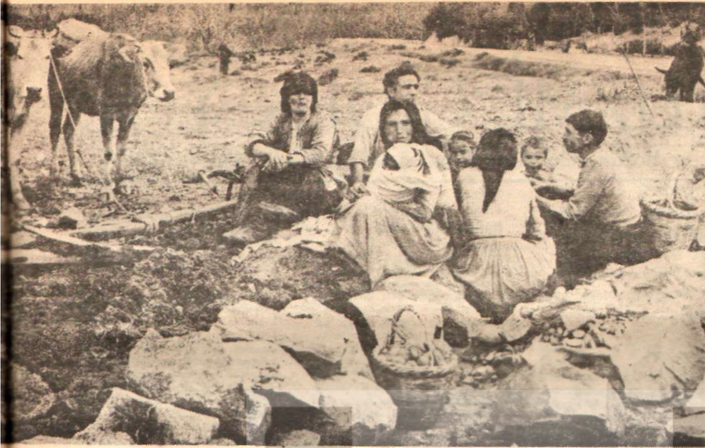
Uçaklarının toprakları üzerinde çalışan ve toprak reformu bekleyen milyonlarca köylü ailesinden biri