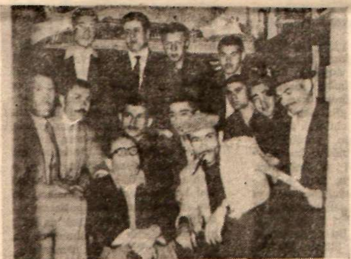
15 grevci 27 gün yattıkları hapis hane köşesinde — «Ekmeçini isteyen hapse atılır mı?» —