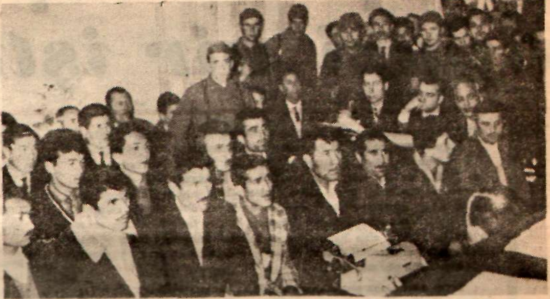
28 KAVEL İŞÇİSİ 35 GÜN SÜREN HAK KAVGASINI TÜRK HAKİMİNE ANLATTILAR

Ve bir pazartesi tevkif edilip evlerinden ayrılan 15 Kavel işçisi 27 gün sonra bir Perşembe gecesi tekrar evlerine dönüyor.