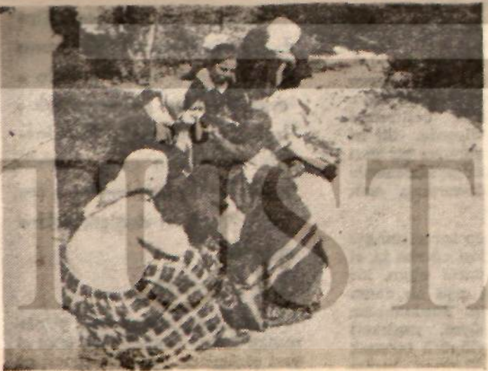
— Bir gün de Adliye kapısında beklediler — Grevcilerin anaları, bacıları, çocukları