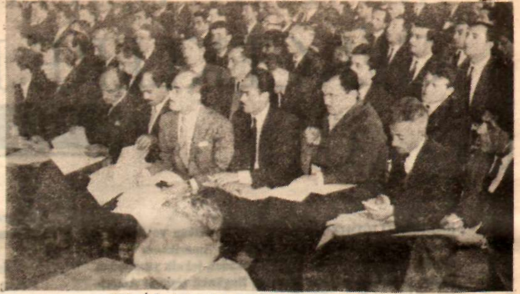
Türk-İş'in tarihi toplantısını izleyen sendikacılar.

Türk - İş yöneticileri Ankara'ya çağırıldıkları sendikacılar yeni metodlar öğretiler;