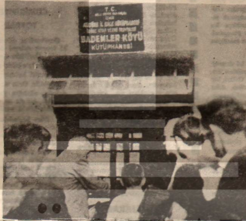
Bademler köyünün kütüphanesi törenle açılıyor — Okuyan, düşünen, aydınlık bir köy —

Ancak, kooperatifi resmen kurmak için yeni bir tüzük gerekiyor du. İŞimdiye kadar Türkiye'de böy